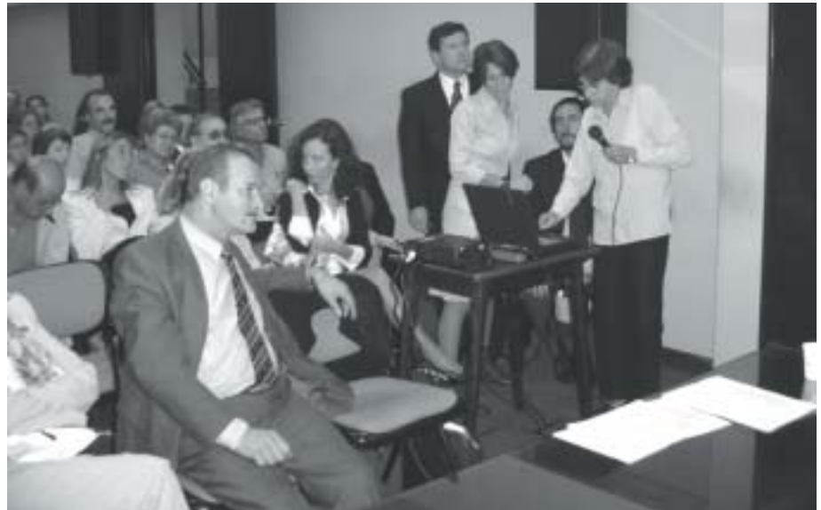
Curso de nutrición 2005.

Por último, un 29% de los médicos que se capacitó en el CEMP manifestó