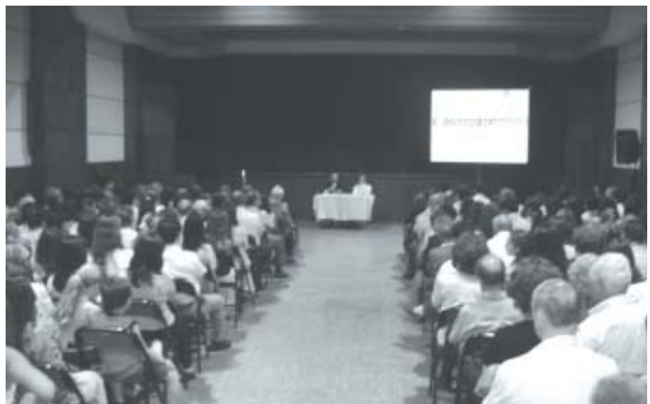
Acto del CEMP de entrega de certificados del 19 de diciembre de 2005.

que la dirección de los cursos había sido “excelente”. Los demás profesionales dividieron sus apreciaciones entre “muy buena” (48%), “buena” (21%) y “regular” (2%).