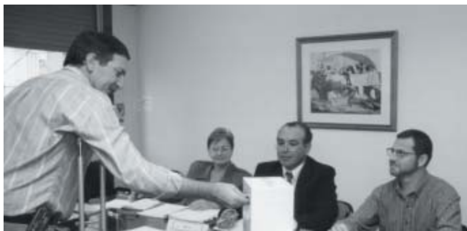
Acto eleccionario anterior en el 2003.

El proceso eleccionario será entre el 3 y el 7 de abril, procediéndose de inmediato, previo recuento, a la iniciación del escrutinio y proclamación de los delegados electos. El horario de votación será de 8.30 a 13.15 en la sede del Colegio de Médicos 2da. Circunscripción, Pellegrini 1705 España 1715 o por Correo Postal con el matasellos con fecha entre el 3 y 7 de abril.