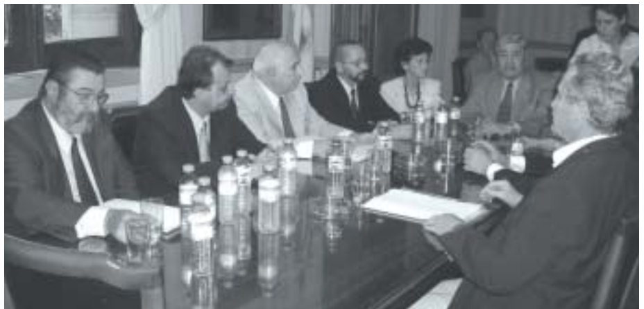
El 23 de noviembre se presentó en la Legislatura del proyecto de la nueva ley.

Para ampliar la base de aportantes se crean nuevas categorías, especialmente para los profesionales jóvenes , atendiendo a sus posibilidades de pago y previendo que, si éstas mejoran, puedan pasar a una categoría superior y tener