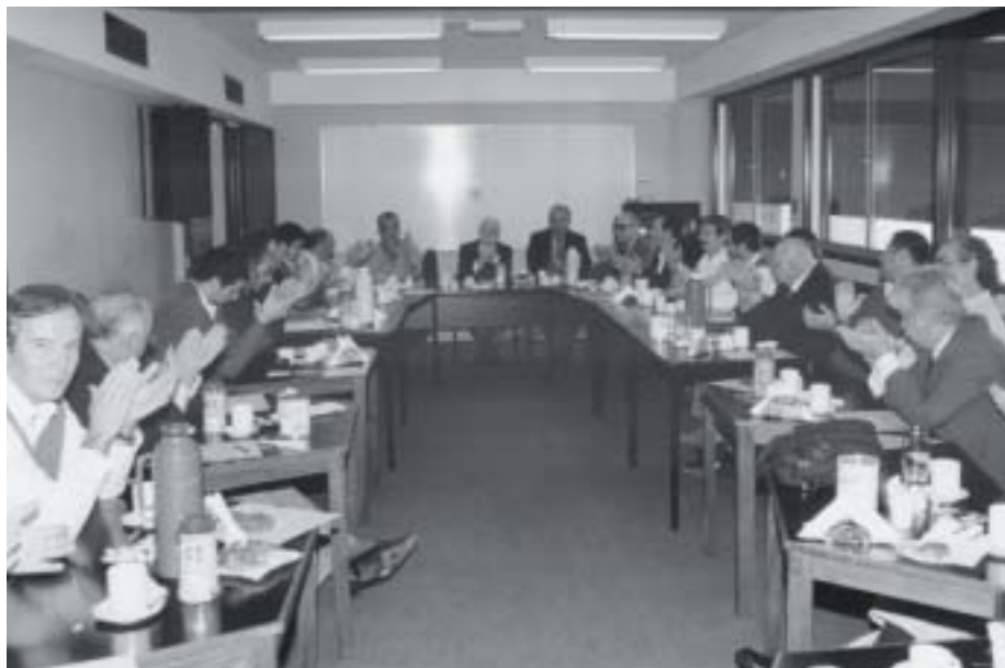
Consejo Asesor que también culmina su mandato.

No hicimos más que insistir y mejorar la labor formativa y de capacitación que desde hace años realizamos a través de distintos mecanismos. Mediante el Centro de Educación Médica de Posgrado , (CEMP) favorecemos la educación médica continua con métodos actualizados y accesibles en un programa anual de actividades que mereció una evaluación altamente positiva por parte de los colegiados que se beneficiaron con estas actividades.