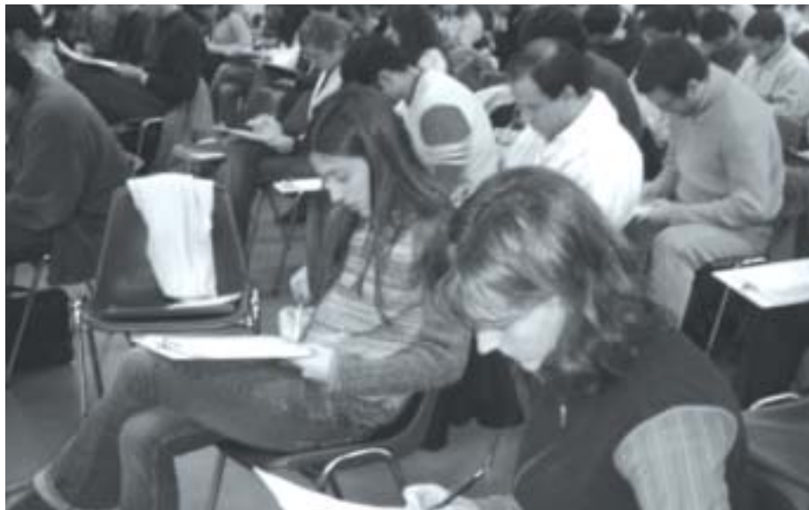
Examen del concurso unificado para residencias y concurrencias.

Para esta iniciativa invitamos a los jefes de servicio pertinentes, quienes no sólo participaron activamente luego de haber sido informados sobre la temática en cuestión, sino que manifestaron su acuerdo con el objetivo propuesto, consensuando la metodología de trabajo. Al mismo tiempo formamos una comisión con la finalidad de elaborar la normativa adecuada para regla-