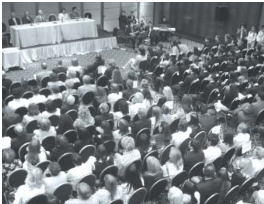
Acto de entrega de certificados a los nuevos especialistas en diciembre del año pasado.

Pruebas de Evaluación: agosto, setiembre y octubre de 2006.