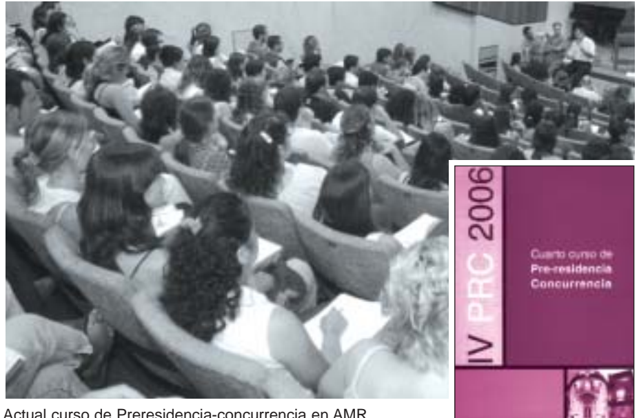
Actual curso de Preresidencia-concurrencia en AMR.

Este año por primera vez se proporcionó un material de estudio que incluye un libro de trescientas páginas que presenta todos los materiales del curso elaborados por los propios docentes y un cd de apoyo.